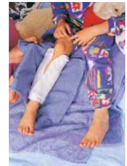
Das geht schnell und hilft rasch: Wadenwickel. [AM]