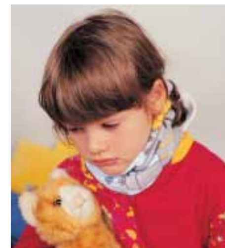
Als »Füllung« des Halswickels kommt in erster Linie die Zwiebel in Betracht (die Zwiebel wirkt darauf zu achten, dass die Haut nicht verbrannt wird (an der Innenseite des eigenen Handgelenks vortesten). [AM]keimabtötend und hält die Schleimhäute feucht). Bei warmen Wickeln, etwa mit Kartoffeln, ist