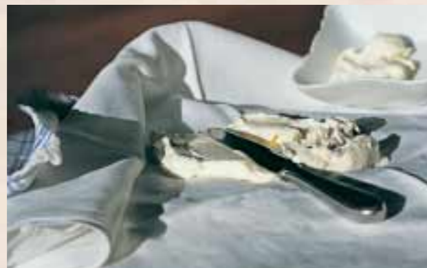
Lindert Entzündungen, etwa bei der Bronchitis: der Quarkwickel [AM]

► Warme Wickel dagegen bleiben länger liegen, von 30 Minuten bis zu mehreren Stunden – oder eben so lange, bis sie dem kleinen Patienten zu kühl oder unangenehm werden.